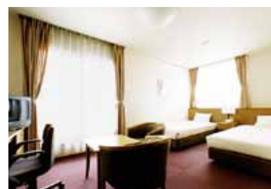
シングル(9室)、ツイン(1室) (各室バス・トイレ付) インターネット接続可能