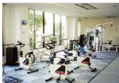
スポーツジム機器